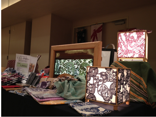
ミッドタウンでの港区ものづくり商業観光フェア