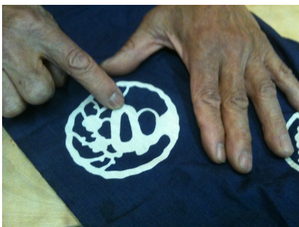
刀の鍔と浴衣の刀の柄の違い